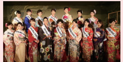
2016ミス日本酒もゲストで登場! (3月10日に京都での最終選考会で決定)