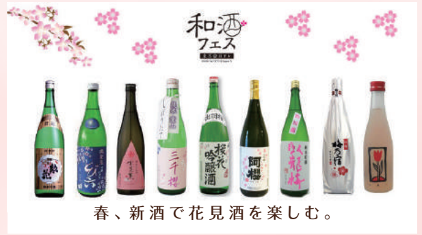
春、新酒で花見酒を楽しむ。

酒蔵自慢の美味しい日本酒と蔵元との出会い、日本文化との出会いを発見してください。